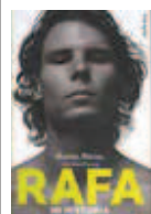
Rafa, mi historia JOHN CARLIN Ediciones Urano